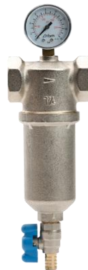
Schéma funkčnosti filtru

Provozní medium vtéká do separační komory, která slouží k oddělení nečistot, které jsou v provozní kapalině. Ty jsou zachyceny do akumulární záchytné komory, která brání jejich další cirkulaci systémem. Filtrační vložka je o jemnosti 100 mikronů. Tím je zajištěna maximální efektivnost filtrace, kdy je minimalizováno riziko rychlého zanesení filtru a zároveň tak zvyšuje využití filtrační kapacity.