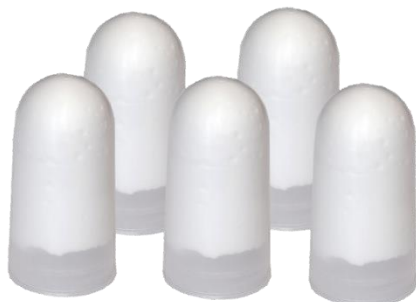
Sada 5 náhradních náplní