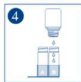
10 ● Cl-2