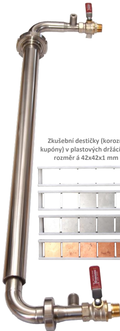
Zkušební destičky (korozní kupony) v plastových držácích – rozměr á 42x42x1 mm

V průběhu zkoušky se měří a zaznamenává průtok a teplota, přičemž zkouška trvá nejméně 90 dnů. Pro stanovení korozní rychlosti je třeba více vzorků s různou dobou expozice (60, 90 a 120 dnů). Pro upřesnění hodnoty korozní rychlosti je třeba provést zkoušku s delší dobou expozice (min. 120 dnů)